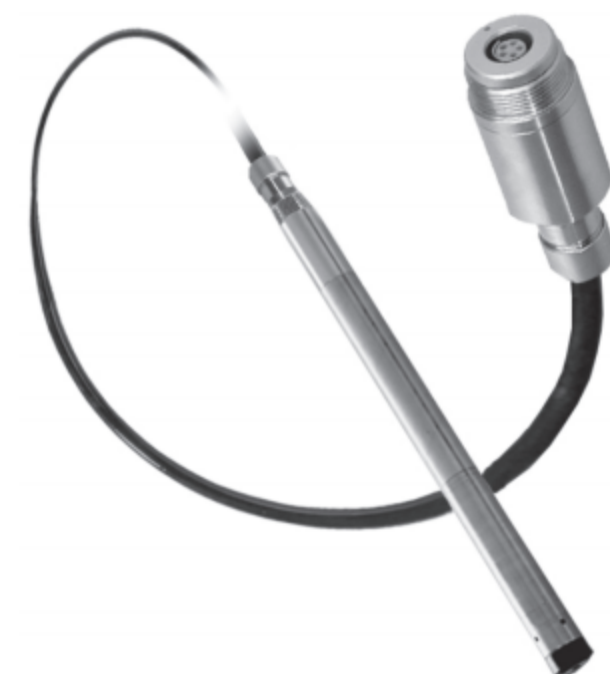
Version DCX-16 SG DCX-16 VG