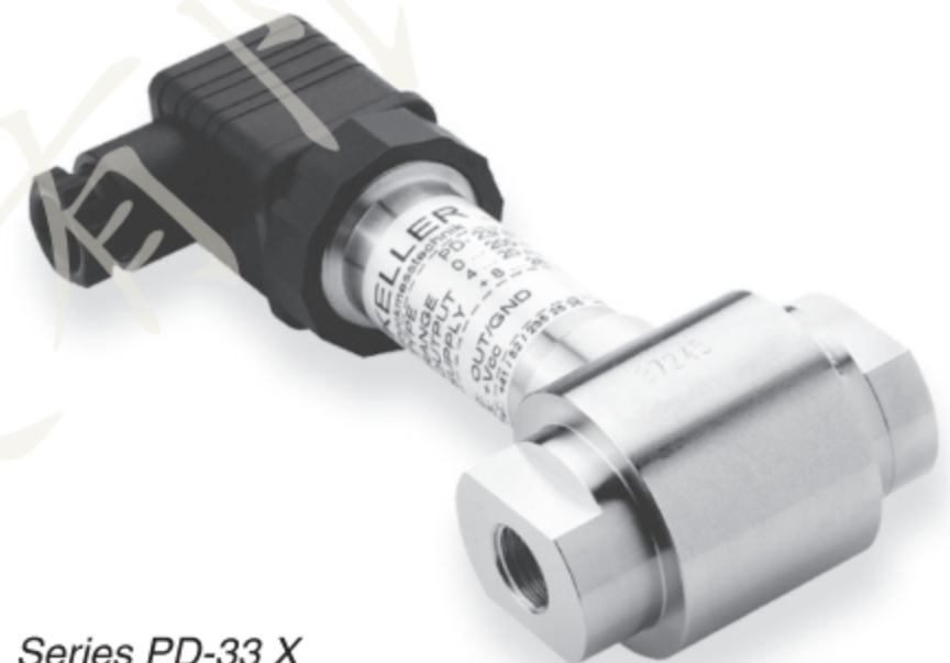
Series PD-33 X