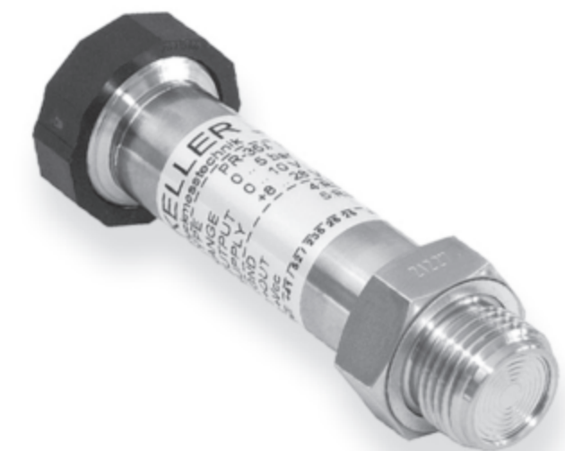
Series 35 X G1/2", flush diaphragm