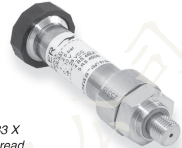
Series 33 X G1/4" thread